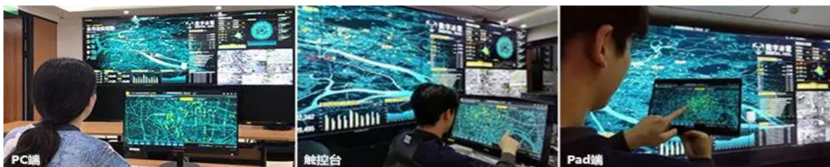
多种交互设备支持

原生支持大屏多屏交互联动控制，支持席位、电子沙盘、手持/固定触控终端等多种控制设备，具备单点主控、集群联动的一体化操作模式，通过统一的控制终端，轻松对多屏显示内容集中控制，如主题切换、分析态切换、可视化对象浏览、点选、筛选、圈选、地图平移放缩等功能。